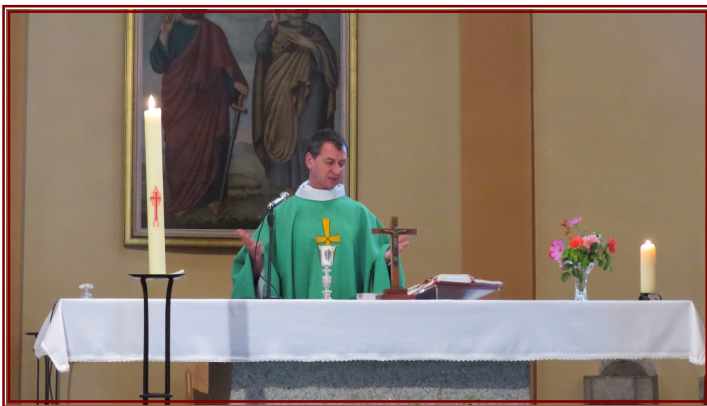
Célébration d'une messe à la Balme de Thuy en août 2015