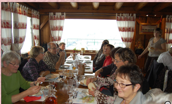
...Ensuite, à l'intérieur du restaurant chaleur et bonne humeur....