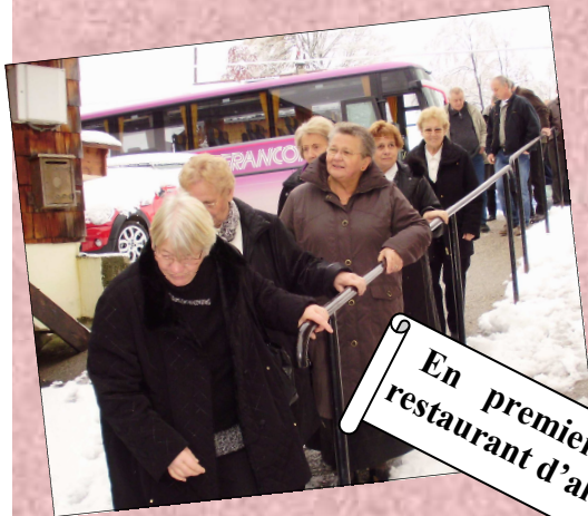
En premier, accéder au restaurant d'altitude....

Vient ensuite le moment très attendu du déjeuner aux saveurs locales, dans le restaurant Le Vieux Mazot à Bogeve.